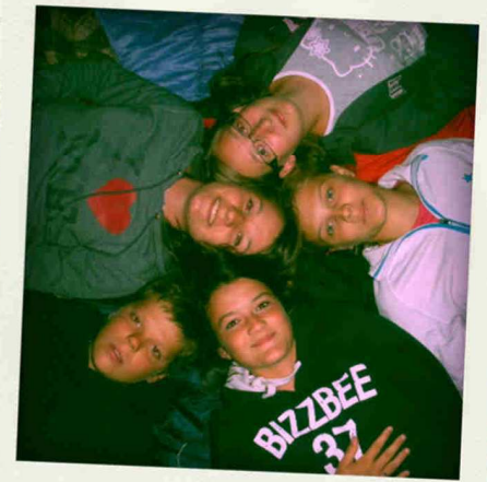
NUITS À LA BELLE ÉTOILE