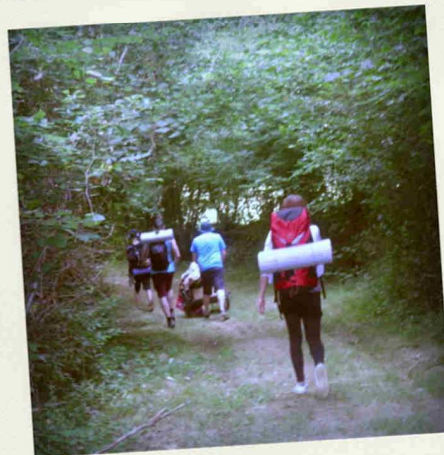
BIVOUAC DANS LA CREUSE